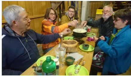
Die Pasteurinnen und Pasteure vom Montag beim wohlverdienten Fondue

Dank der Mitarbeit von so vielen freiwilligen Helferinnen und Helfern kam das Resultat von 3'125 Liter Most zustande.