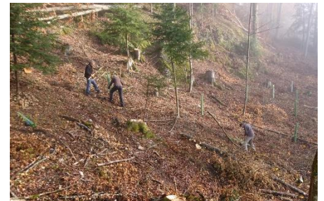
Pflanzen von Jungbäumen