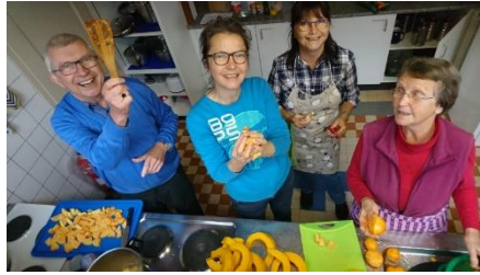
Familie Killenberger beim Zubereiten der Kürbissuppe für 30 Personen