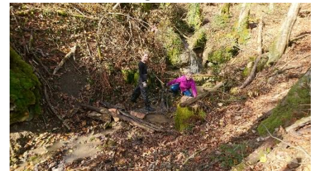
Säubern des Rifensteinbachs