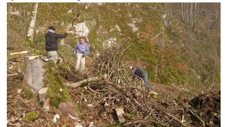
Erstellen von wieselgerechten Asthaufen