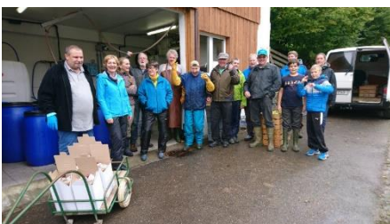
Helferinnen und Helfer der Samstagsgruppe